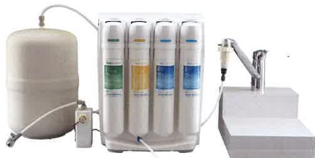
メガユニティセット