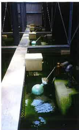
他社有機系殺菌剤