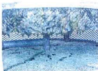
オルガードパックV3 未使用時