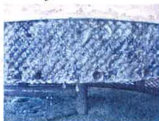
オルガードパックV3 使用時